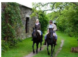
Laguna de Castillos