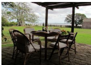
Punta del Diablo 🚗 50km - 🕒 40m Laguna de Castillos