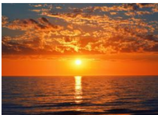
José Ignacio 📍

🚗 35km - ⌚ 40m Punta del Este 📍 🚗 130km - ⌚ 2h 15m Montevideo 📍