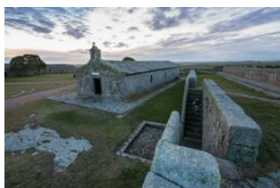
Punta del Diablo